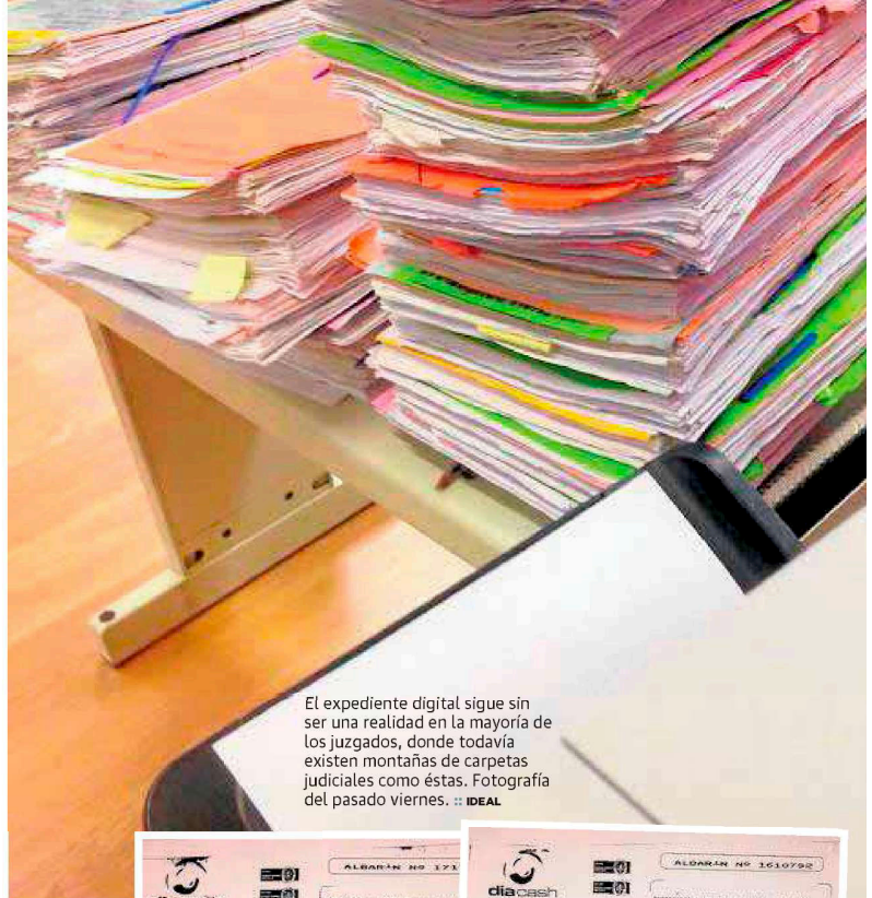
El expediente digital sigue sin ser una realidad en la mayoría de los juzgados, donde todavía existen montañas de carpetas judiciales como éstas. Fotografía del pasado viernes.

Antes las partes presentaban copias de sus escritos y no hacía falta imprimirlos